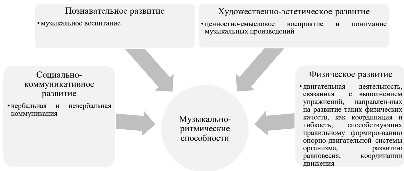
Рисунок 1 – Структурные единицы, представляющие определенные направления развития и образования детей в контексте развития музыкально-ритмических способностей детей дошкольного возраста

Музыкально-ритмические способности являются многосторонним комплексом. Более наглядно взаимосвязь представлена на рисунке 1.